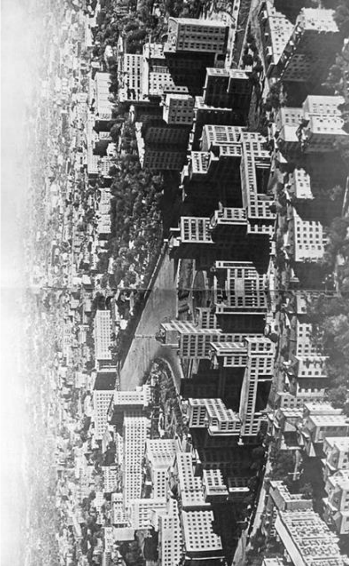
Рис. 4. Архитектурный ансамбль площади Дзержинского. Харьков, 1950-е гг.