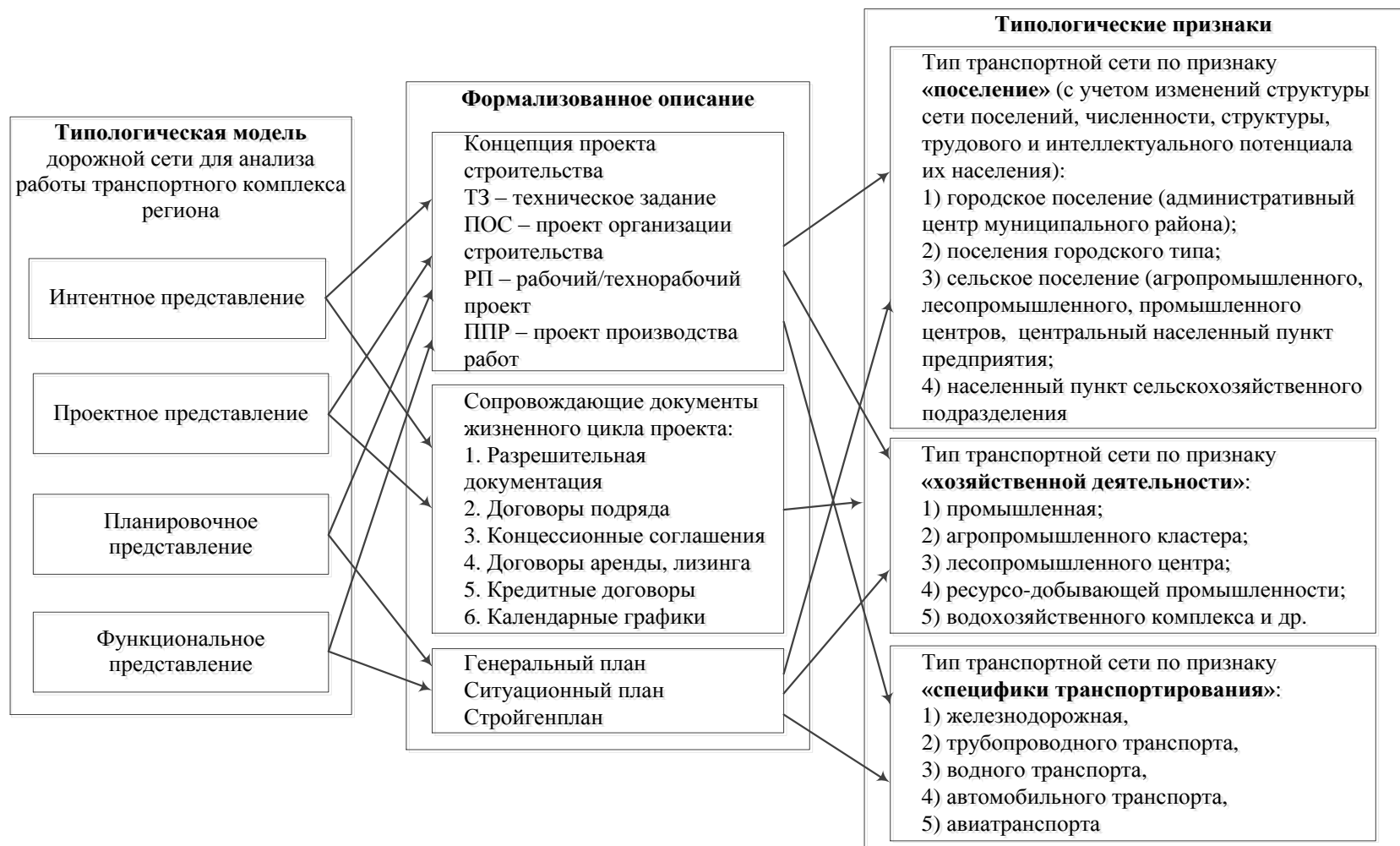
Рисунок 2. – Применение типологических моделей транспортной сети (МТС) для проектирования дорожной сети